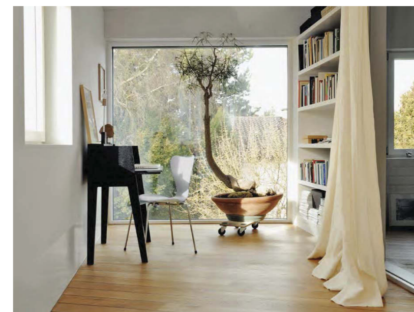
► Stuhl 3107 Arne Jacobsen Sekretär At-At Tomoko Azumi Vorhänge Flora Fanny Aronson