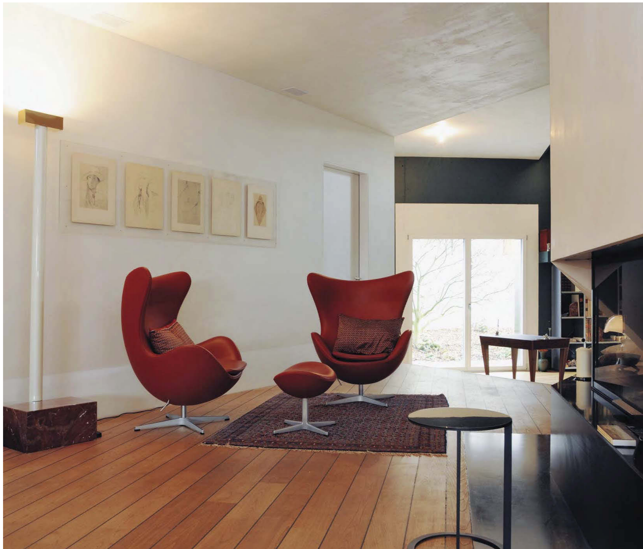
▲ Armlehnsessel Ei Arne Jacobsen Beistelltisch Frank Antonio Citterio